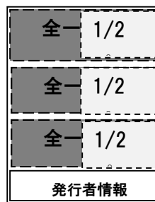
(裏表紙 掲載イメージ)